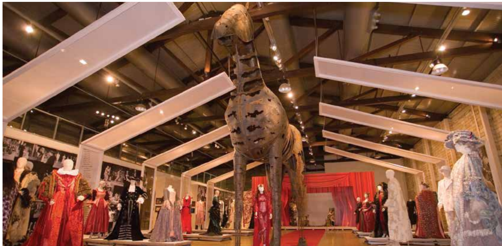
Το Ίδρυμα Ευαγόρα & Κάθλην Λανίτη αποτελεί το «φορέα» μέσω του οποίου

με δωρεά της οικογένειας Λανίτη, το Ευαγόρειο Κέντρο Ανακουφιστικής Φροντίδας του Αντικαρκινικού Συνδέσμου στη Λεμεσό.