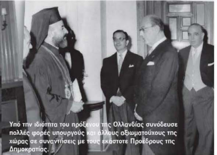
Υπό την ιδιότητα του πρόξενου της Ολλανδίας συνόδευσε πολλές φορές υπουργούς και άλλους αξιωματούχους της χώρας σε συναντήσεις με τους εκάστοτε Προέδρους της Δημοκρατίας.