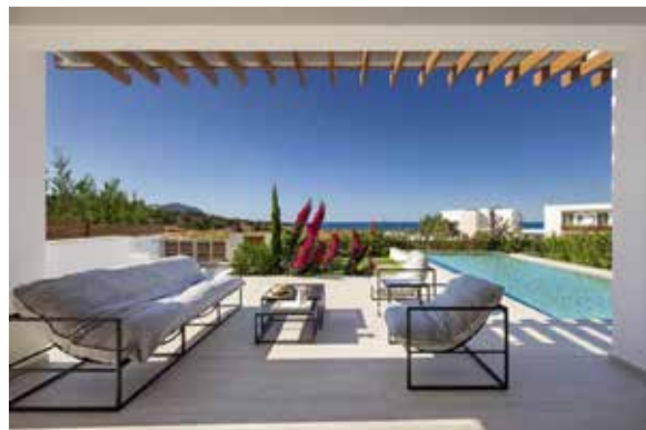
Akamas Bay Villas

Λόγω της έντονης ζήτησης που καταγράφεται για οικιστικές μονάδες στη Λεμεσό, η εταιρεία θα ανακοινώσει σύντομα ακόμα δύο έργα σε επιλεγμένες περιοχές: το Seaview Heights σε πανοραμικό σημείο στη Γερμασόγεια με θέα την πόλη και τη θάλασσα, που θα αποτελείται από διαμερίσματα και επαύλεις και άλλο ένα μικρότερο έργο στο κέντρο της Λεμεσού, με διαμερίσματα ενός και δύο υπνοδωματίων.